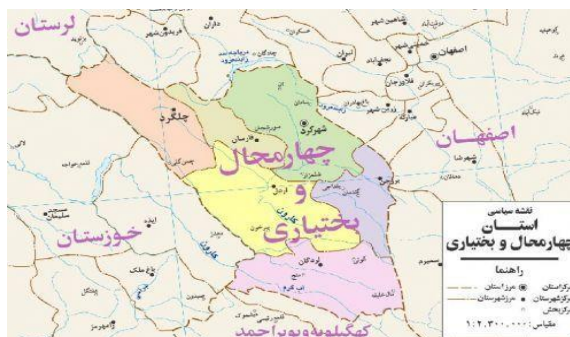
تصویر ۱: نقشه استان چهارمحال و بختیاری